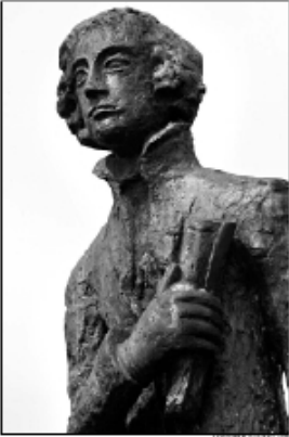
Tocqueville avait pu se distancier à l'égard du catholicisme dominant, mais il avait développé, dans le sillage de la Laïcité, une doctrine de la religion comme facteur social qui devait contribuer à combler les lacunes religieuses dans la nation post-républicaine.